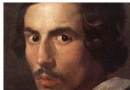
GIAN LORENZO BERNINI