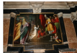
OPERE DI CAMILLO PROCACCINI

CAMILLO PROCACCINI (CAMILLO PROCACCINI) CHIESA DI SANTA MARIA DEL CARMINE